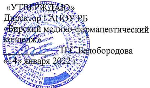
График проведения срезов знаний для самообследования. Специальность 31.02.02 Акушерское дело- ответственная Колонских Е.Г.